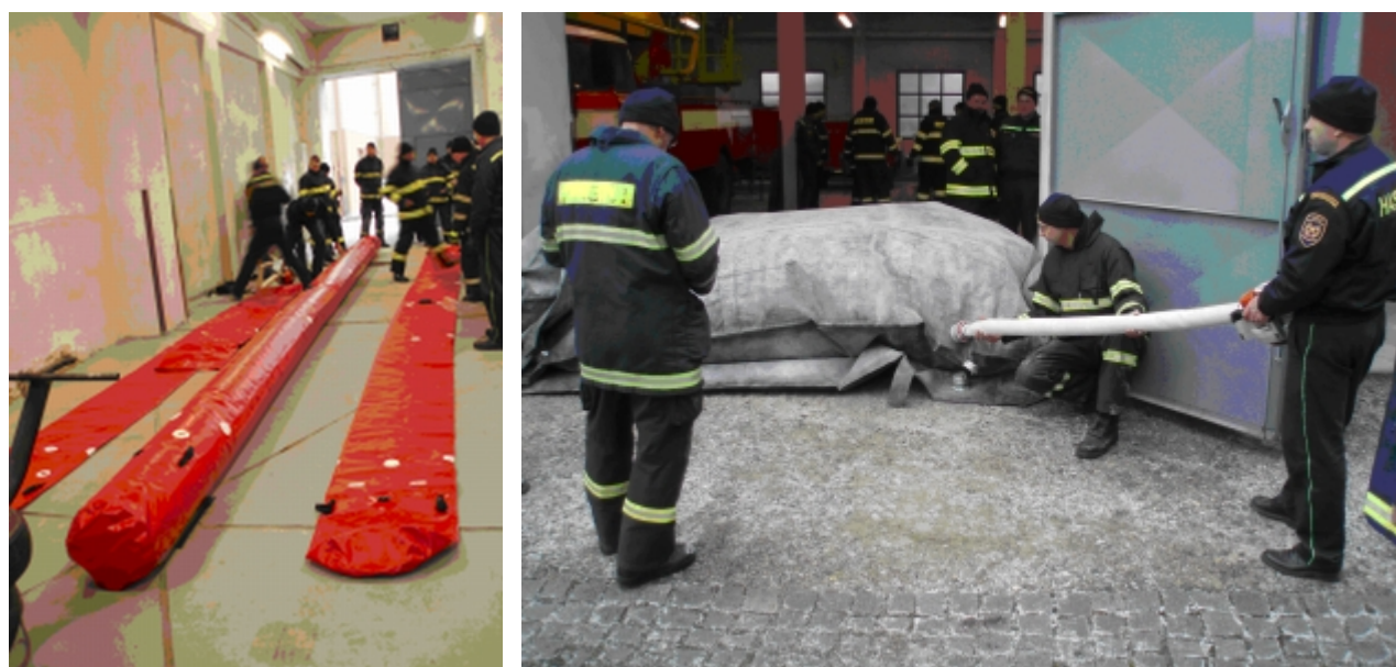
Obrázek 1: Mobilní protipovodňové bariéry

Dalším možným řešením je nákup tzv. mobilních protipovodňových bariér . Na trhu existuje celá řada výrobců těchto systémů, např. GUMOTEX, EKO-SYSTÉM, ZAHAS, PBS Rotava, RUBENA. Mezi jejich základní výhody patří snadná manipulace a skladování , nevýhodou je ovšem jejich finanční náročnost .