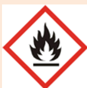
H220: Extrémně hořlavý plyn

Zemní plyn - Extrémně hořlavý plyn. Ve vysokých koncentracích může způsobit udušení. Nemá toxické ani otravné účinky. Při jeho nedokonalém spalování se může vytvářet jedovatý oxid uhelnatý. Při rychlé expanzi může docházet k tvorbě mlh, které zůstávají při zemi, šíří se do okolí a mohou tvořit výbušné směsi.