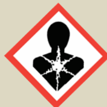
Látka nebezpečná pro zdraví