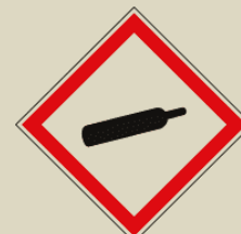
Plyn pod tlakem