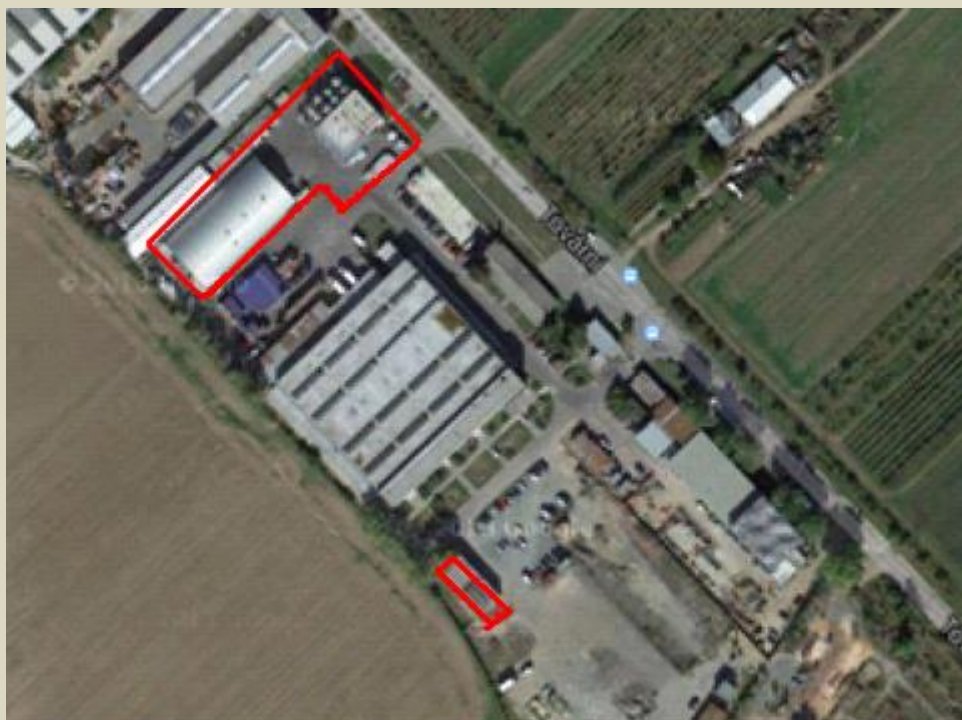
Letecký pohled na objekt společnosti ASK Chemicals Czech s.r.o.

Suroviny k výrobě směsí jsou do objektu společnosti dopravovány v autocisternách nebo IBC kontejnerech. Jsou skladovány v nadzemních zásobnících. Do výsledného produktu jsou kromě těchto surovin přidávány i další komponenty. Dávkování těchto komponent se provádí na plnicí lince automaticky - je řízeno počítačem. Dávkování probíhá podle předem dané receptury, obsluha nepřichází s chemickými směsmi do kontaktu. Jedná se o fyzikální proces, neprobíhají zde žádné chemické reakce. Dávkovací zařízení je vybaveno automatickou vahou a posuvem IBC kontejnerů pod plnicí ventily, dále na pozici míchaní a manipulační pozici, kde dojde k odebrání plného kontejneru z plnicí linky. Manipulace s plnými i prázdnými IBC kontejnery se provádí pomocí vysokozdvížného vozíku. Suroviny, případně výrobky, jsou skladovány ve skladu hořlavin.