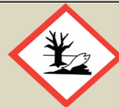
Látka nebezpečná pro životní prostředí