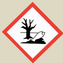
Látky nebezpečné pro životní prostředí