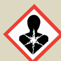
Látky nebezpečné pro zdraví