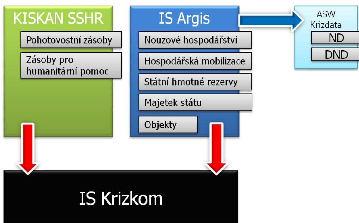
Funkční schéma IS pro podporu HOPKS